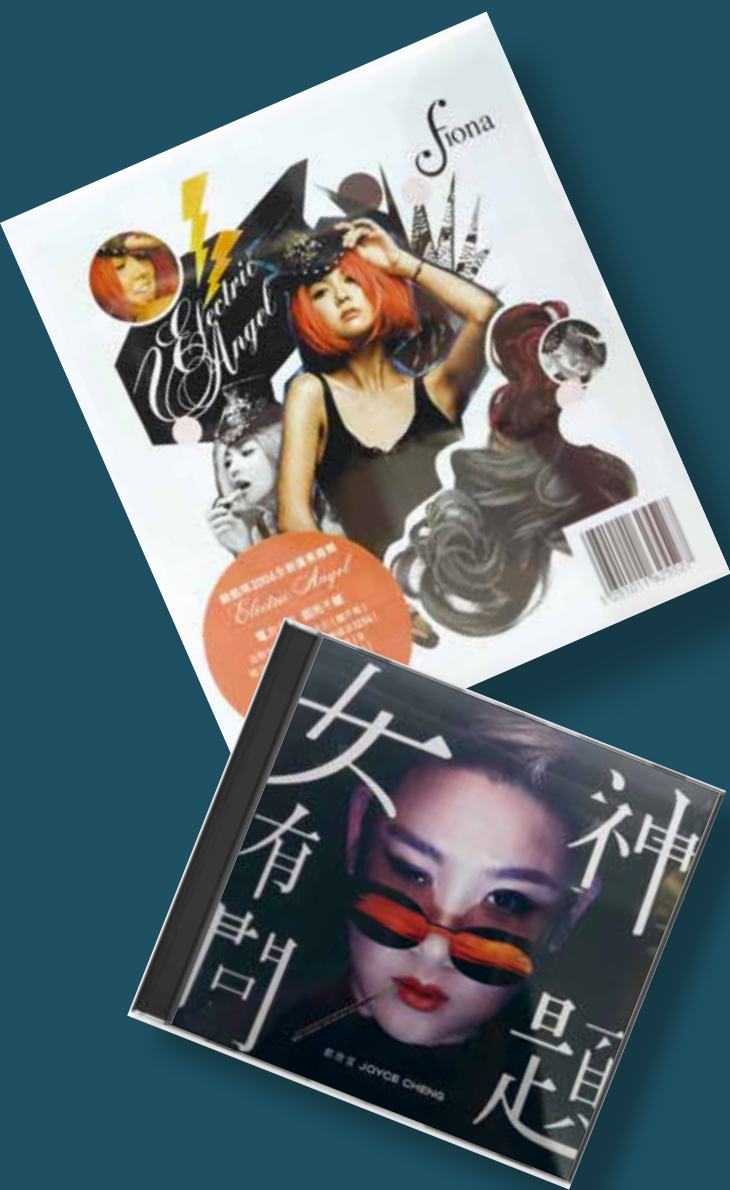
貫徹香港多元文化的特點，廣東歌有關身份認同的題材也十分多樣。

與香港地的生死與共；而此曲由河國榮主唱更別具意義：只要你發自內心熱愛香港，不論你來自何方，你都是真香港人。