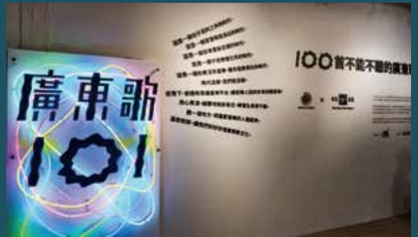
適逢時代廣場現正舉辦音樂企劃《廣東歌 101》多媒體展覽，與本文遙遙呼應，一起細說廣東歌之過去、現在與將來。

回歸不久，香港人先後面對沙士及金融危機，社會再次瀰漫着一片愁雲慘霧。香港歌手聯合演唱《香港心》（2003）、《始終有你》（2007）等曲目，希望為當時的香港人打打氣；《同舟之情》（2013）更沿用經典金曲《獅子山下》（1979）的部分主旋律及歌詞，「人生不免崎嶇 / 難以絕無掛慮 / 既是同舟 / 在獅子山下且共濟」，重申香港人只要結伴同行，便能跨過一次又一次的難關，「同舟之情 / 攜手走過崎嶇」。