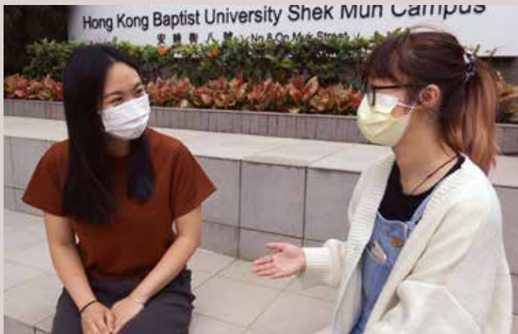
Sushi (左) 認為修讀傳理學有助她從事社區服務的工作。