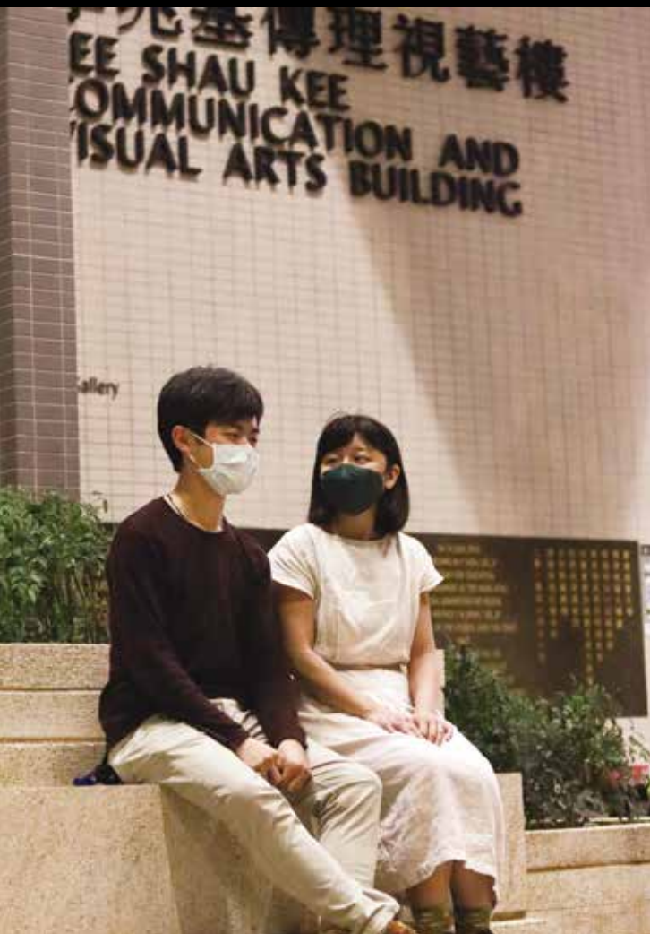
二人表示縱然藝術路上充滿種種障礙，但卻無阻他們前行。

釋。「要是沒有固定答案的話，那便不是藝術了。」受眾從中得到新的感悟，在生活中受到啟發，這便是藝術的意義。作為藝術老師，他希望將當中的知識分享給想做藝術、但又缺乏經驗的人，帶領更多有心的人進入藝術領域，也是身為「藝術人」的其中一個職責。