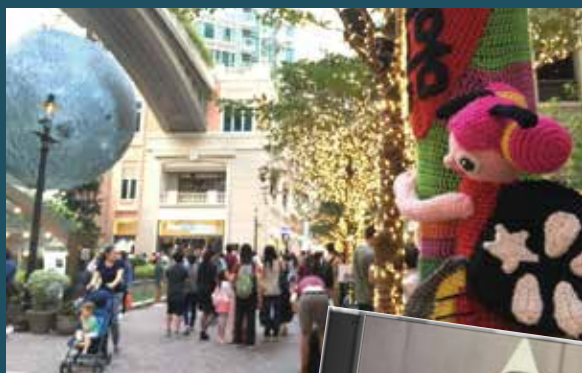
香港的時代曲見證著香港社會的歷史變遷、今昔對比。 （攝於囍帖街——灣仔利東街）

此外，伴隨香港經濟的發展，卻是深刻的社會問題：貧富懸殊、物價高漲，香港已成為高收