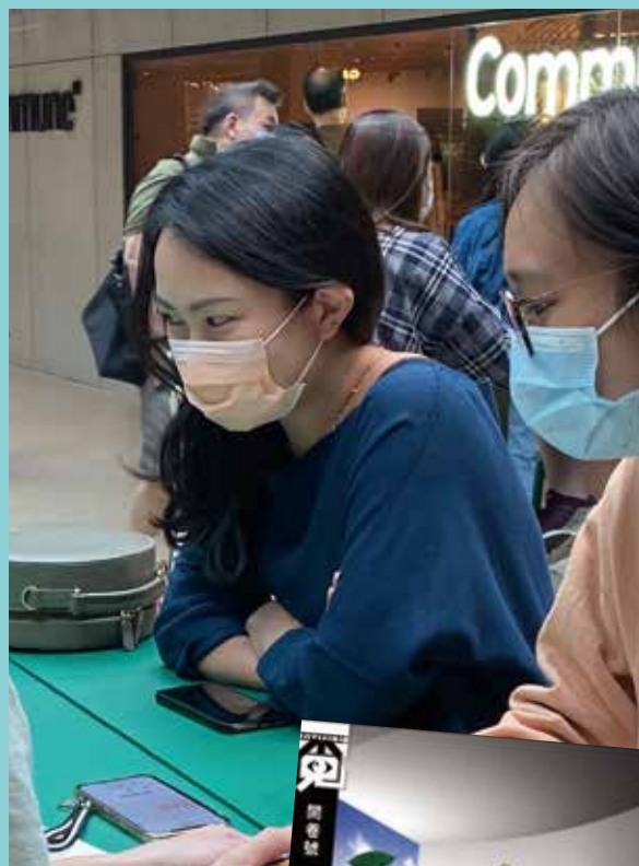
妙詩分享當年籌辦《覓 Invisible》開卷號的經過，見證十五年的薪火傳承。

「修讀新聞學雖然對於想成記者的學生有用，可以使其學習到新聞學相關的技術性知識。但成為一名記者也不一定要修讀新聞，因為新聞記者有多個種類，不同專修也能勝任。因此，最終還是要視乎自己想成哪類型的記者，不同類型的記者所需要的『養分』亦不同，例如想成為副