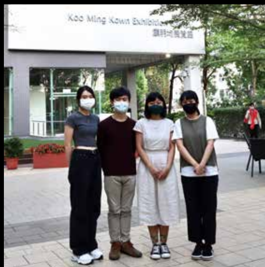
CIE 同學與受訪者合照。

誠然，面對縱橫交錯前路，或許會遭遇不同的挫折，我們會感到迷惘、沮喪；但只有堅持下去，才對得起曾經為此而努力過的自己。☞