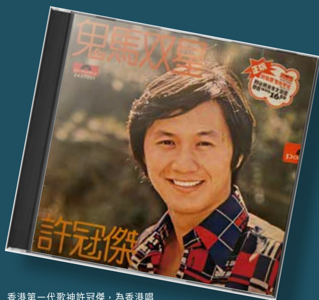
香港第一代歌神許冠傑，為香港唱出多首時代金曲。

七十年代以前，廣東歌大多是以粵曲的形式出現，至許冠傑的出現方開拓了「粵語歌」的新道路，其《鐵塔凌雲》（1972）更成為了廣東歌的經典，「豈能及漁燈在彼邦」直接訴說其香港情懷。七十年代的廣東歌，多偏向描述基層市民的生活環境，如《鬼馬雙星》（1974）講述了七三年股災後市民所面對的困境，「為兩餐乜都肯制前世 / 撞正輪晒心翳滯無謂」；而《半斤八兩》（1976）「半斤八兩 / 雞碎咁多都要啄」、「嗰種辛苦折墮講出嚇鬼（死俾你睇） / 咪話無乜所謂」則點出當時的市民收入微薄，生活艱難。