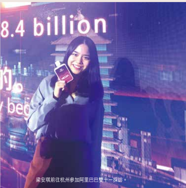
梁安琪前往杭州參加阿里巴巴雙十一採訪。