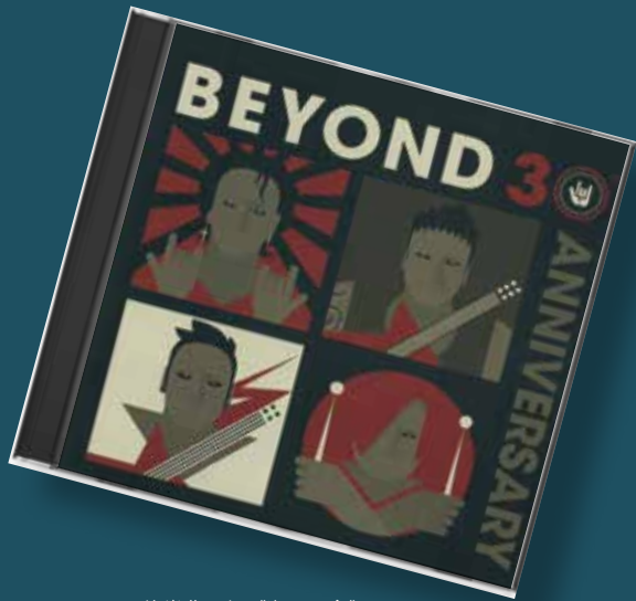
Beyond 的樂曲，如《海闊天空》、《歲月無聲》，唱出香港人對追求理想與自由的堅毅不屈。

史議題，社會浮躁不安。這段時期的廣東歌，無不反映香港人當時的憂患意識，「這是個暫借的美夢 / 生不了根」（《借來的美夢》，1981）；而《話知你 97》（1990）「移民外國 / 亦係聽糟質」、「其實香港適應力強未嚇窒」，及《皇后大道東》（1991）「知己一聲拜拜遠去這都市 / 要靠偉大同志搞搞新意思」，更分別以鬼馬生動及象徵隱喻的方式，描繪九七移民潮時期的港人心態。